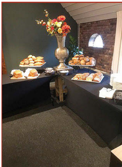
Paasbrunch 16 april 2025