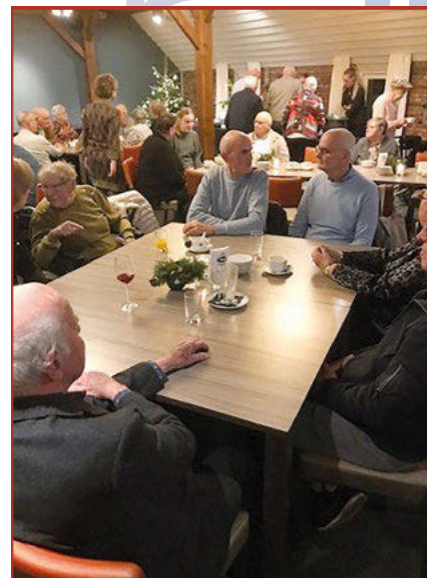
Kerstdiner 13 december 2025

Dit jaarverslag van de secretaris over 2025 biedt u een overzicht van het doen en laten van onze vereniging en de gehouden activiteiten.