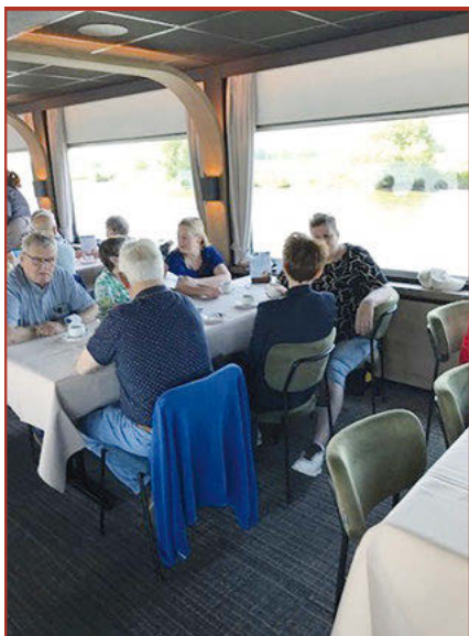
Boottocht 12 juni 2025