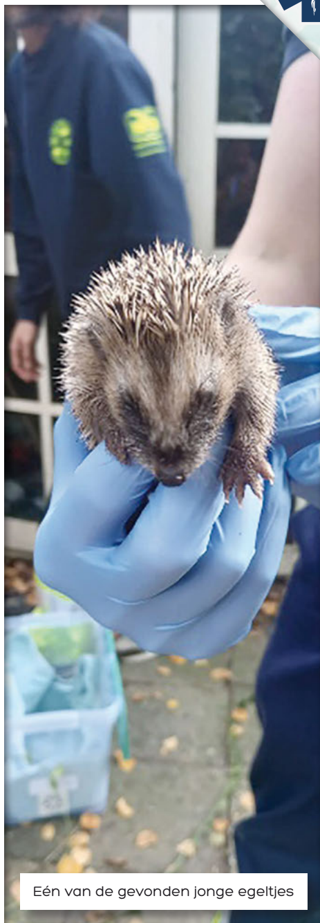
Eén van de gevonden jonge egeltjes