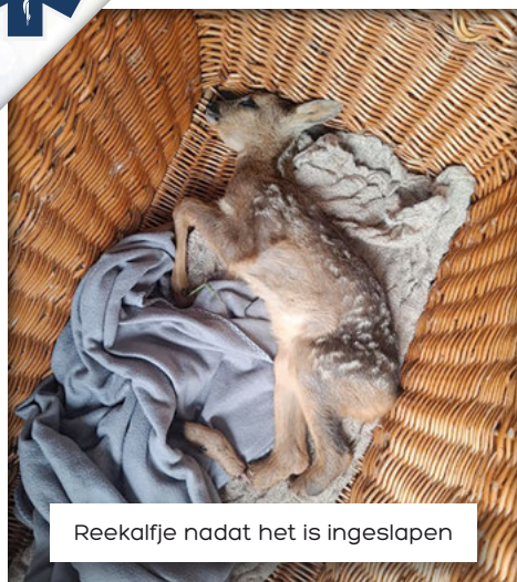
Reekalfje nadat het is ingeslapen

Overreden door een maaimachine. Het kalfje moest worden geëuthanaseerd. Ik stond bij de dierenarts te huilen alsof mijn eigen huisdier werd ingeslapen. Misschien nog wel erger. Dit diertje was nog maar net op de wereld. Zo klein. Zo weerloos. En dan al zoveel angst en pijn moeten doorstaan.