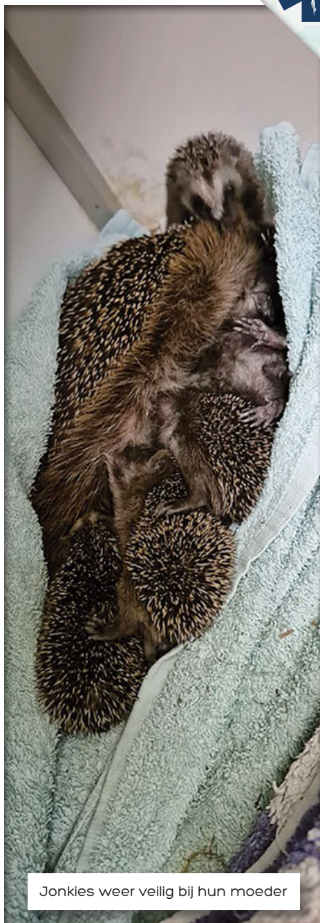
Jonkies weer veilig bij hun moeder