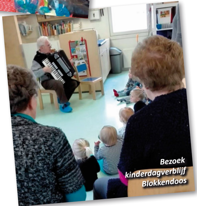
Bezoek kinderdagverblijf Blokendoos