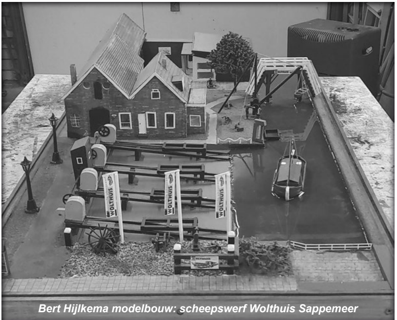
Bert Hijlkema modelbouw: scheepswerf Wolthuis Sappemeer

Na ruim 550 uur bouwen is het een (al zeg ik het zelf) prachtig schaalmodel geworden wat straks op de werf ter bezichtiging staat voor alle bezoekers.