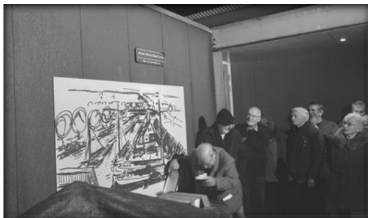
Het “Bram Blaak terras”