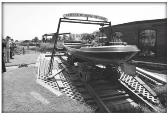
Vaders museale helling

Halverwege het jaar gingen we op studiereis en wel helemaal naar Broek op Langedijk waar de historische sleephelling van Vader gevestigd is. Een bus van het busmuseum bracht ons daar maar niet meer terug want na een fantastisch feestmaal in de omgeving van de Afsluitdijk, zei de bus “doe `t zelf maar”. Een paar uurtjes later kwam er een VIP-exemplaar ons oppikken en we waren een paar uurtjes later thuis dan gepland. Een mooie terugreis onder het zingen van “potje met vet” en de ondergaande zon in het Groninger land maakte deze dag onvergetelijk.