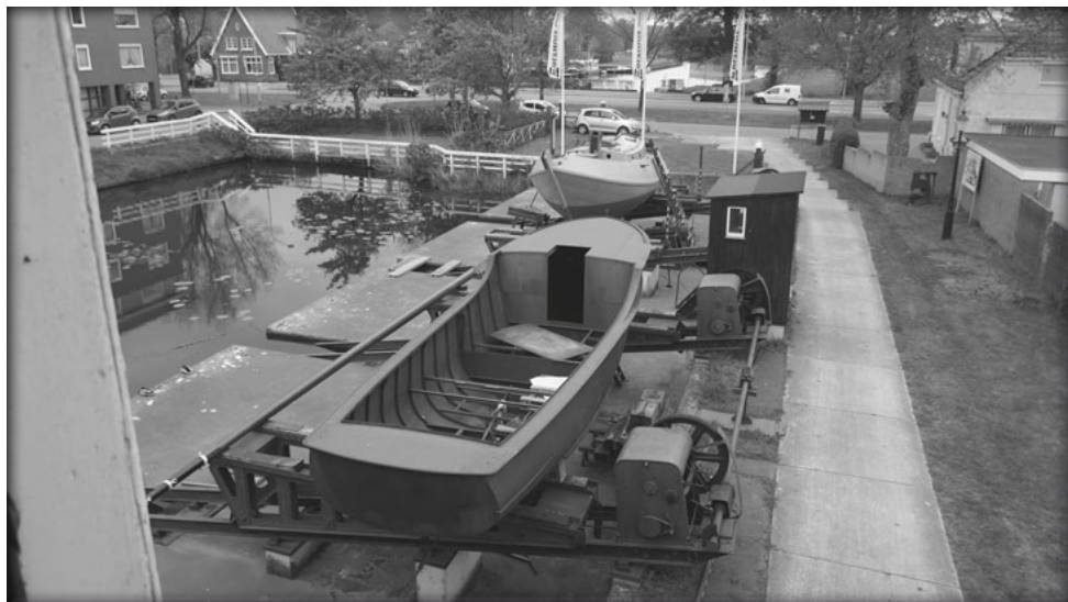
Een volle helling

Zo kwam er nog een historisch scheepje bij op de helling, een Akerboom Bakdek-kruiser uit 1935. Restauratie en inbouw van een historische Mercedes motor zijn hier de werkzaamheden voor het komende jaar. Daarna, als het scheepje gestraald en geveerd is, mogen de timmerlui erin om hun kunsten te tonen. U begrijpt, een meer-jaren project.