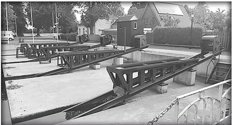
De huidige dwarshelling met de 4 hellingwagens

In de huidige dwarshelling zijn zoveel mogelijk onderdelen van de oorspronkelijke dwarshelling gebruikt, maar sommige waren zodanig door de tand des tijds aangetast dat ze zelfs niet met de nodige reparaties nog bruikbaar waren. De oude hellingwagens (of wat er nog van over was) zijn op tekening gezet en door leerlingen van de Metaal en Scheepsbouwopleiding in Groningen keurig in stijl nagebouwd en de rails, inclusief ondersteuning, zijn boven water geheel vernieuwd. De wielen en de kabelschijven van de wagens zijn, na bewerking, weer hergebruikt. De oude lieren zijn, na de nodige reparaties, weer boven aan de rails geplaatst.