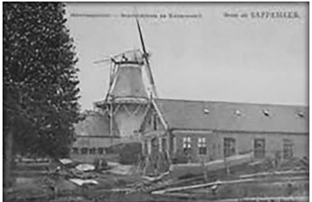
De oude langshelling

Nieuwbouwschepen werden in die tijd iets verder naar achteren, naast de stenen scheepsbouwloods, gebouwd. De dwarsscheepse tewaterlating gebeurde op de bekende manier.