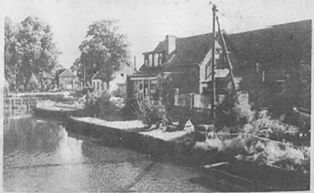
De werf van Wolthuis in Sappemeer waar de grond mogelijk vervuild is.

Met het bodemonderzoek is een bedrag gemoeid van 3300 gulden exclusief BTW.