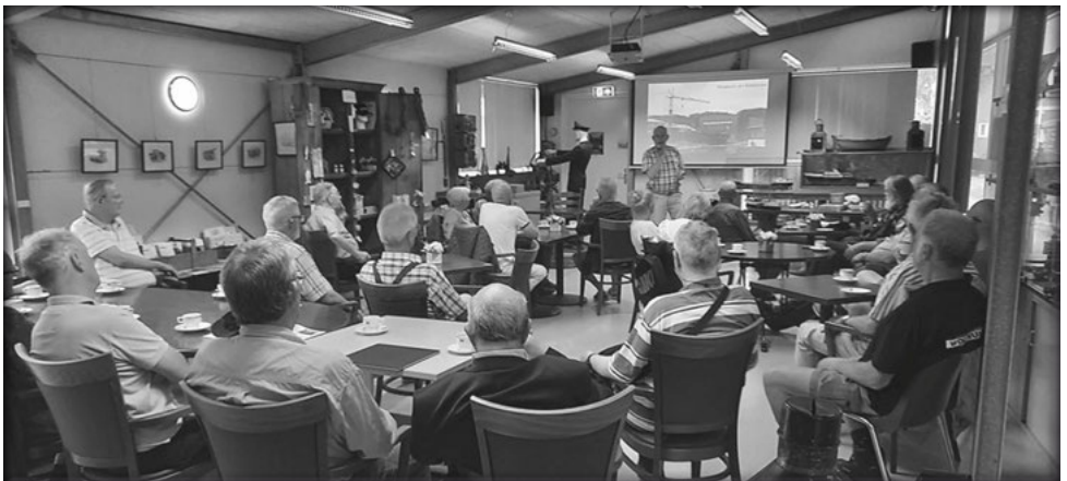
Eén van de schipperscafé's

De nu volgende “operationele” werkzaamheden op de werf bestonden voornamelijk uit het aanstellen van vrijwilligers voor rondleidingen, onderhoud, verdere inrichting van de werfgebouwen en niet in de laatste plaats het verkrijgen van financiën voor de exploitatie.