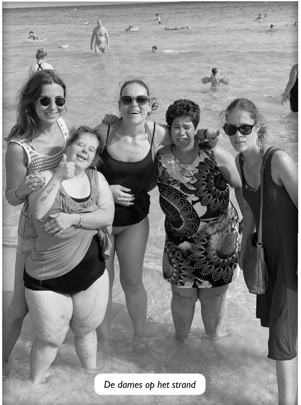
De dames op het strand

Natuurlijk hebben we ook dit jaar de nodige uitjes gemaakt en zijn we regelmatig van het resort af geweest om op avontuur te gaan. Zo hebben we de bus gepakt om op de markt in het plaatsje Artá te kunnen shoppen en hebben we