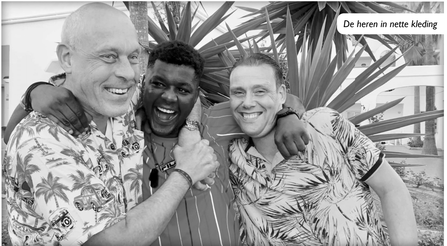
De heren in nette kleding

Niet alleen overdag, maar ook de avonduren vlogen voorbij. Niets fijners om de avond te beginnen met een spannend potje bingo, om vervolgens door te schuiven naar de meest waanzinnige shows. Zo zijn we vermaakt door verschillende Disneyfiguren als Elsa, de Kleine Zeemeermin, Aladdin en Woody én hebben we onze ogen uitgekeken tijdens een verrassende goochelshow.