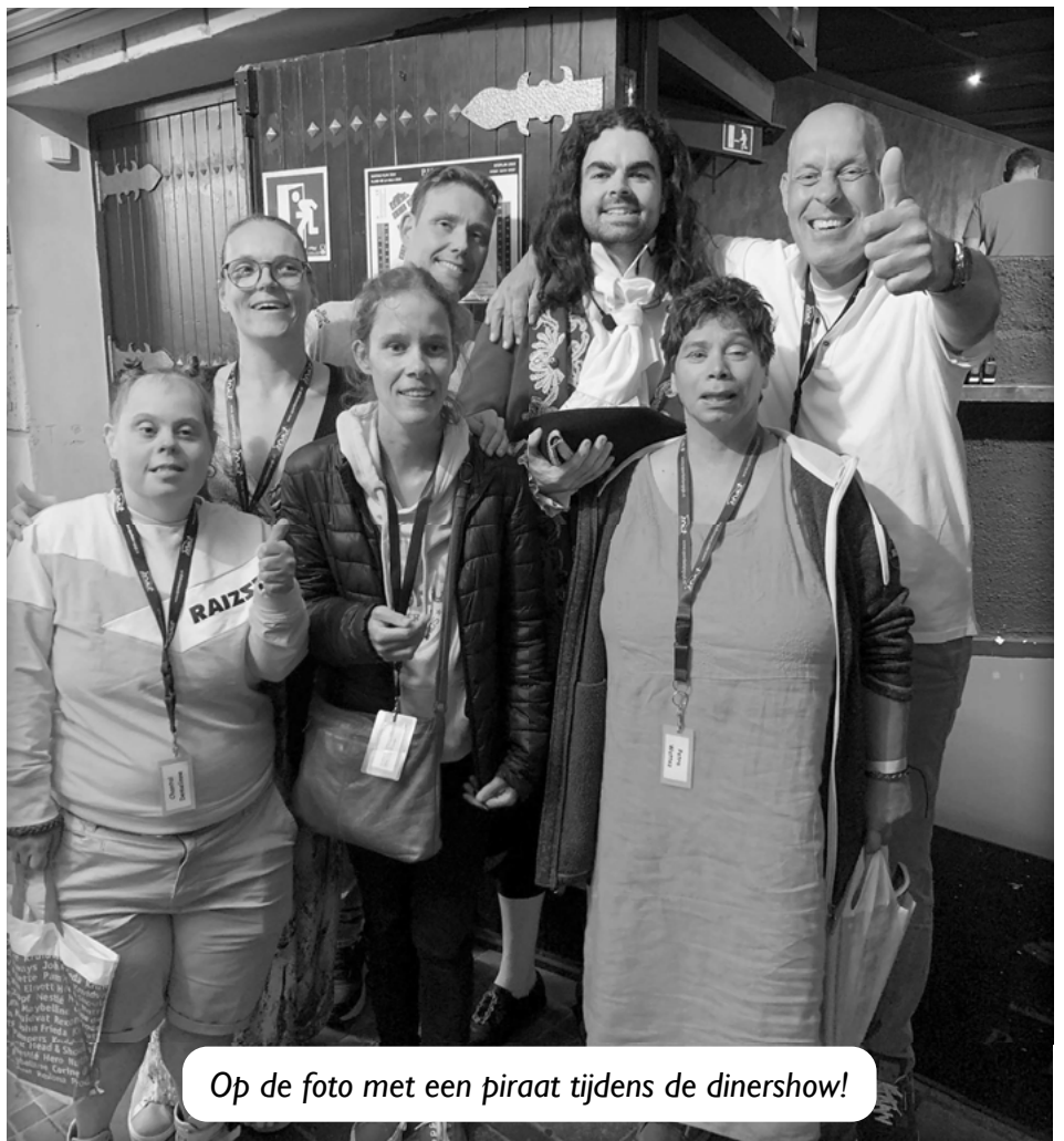
Op de foto met een piraat tijdens de dinershow!

En alsof die shows op het resort niet al (gek) genoeg waren, zijn we op vrijdagavond (de laatste/bonte avond) de bus in gestapt richting een wel héél bijzondere locatie: een dinershow met piraten! We werden verwelkomd met een groot bord vol kip en patat en zijn de hele avond geëntertand door tientallen piraten. Een avond om niet snel meer te vergeten en tegelijkertijd een fantastische manier om deze succesvolle, geslaagde vakantie af te sluiten.