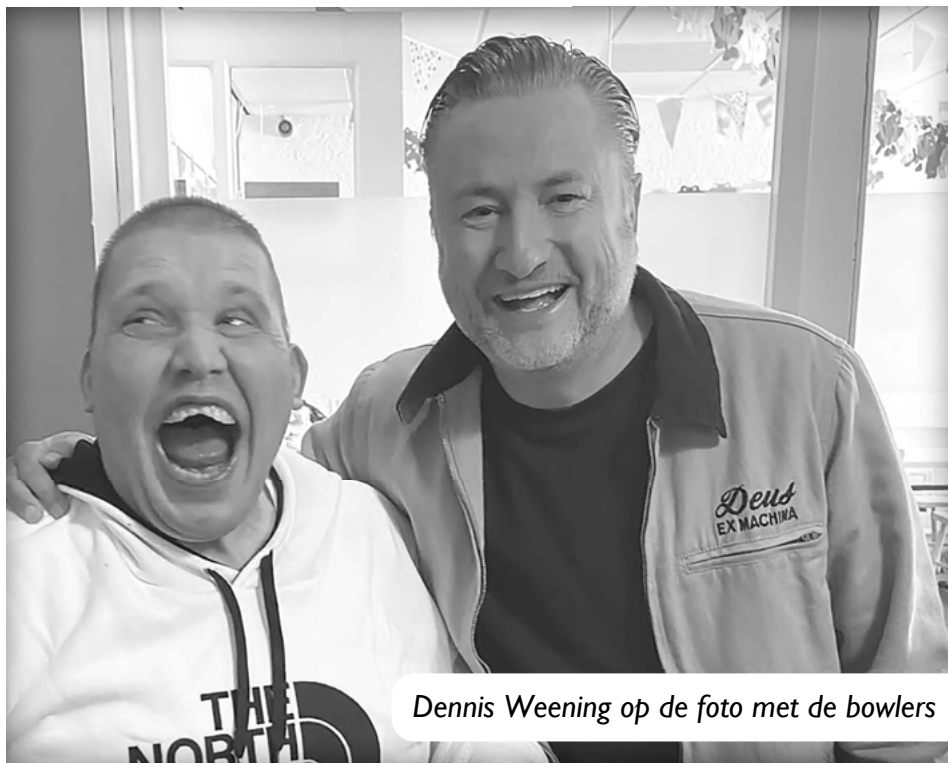
Dennis Weening op de foto met de bowlers

Wat deze editie van het bowlingproject misschien nog wel extra speciaal maakte was het fotomomentje met Dennis Weening. De DJ liep op een van de zaterdagen toevallig ook rond in het bowlingcentrum omdat zijn dochter een dagje ging bowlen. Natuurlijk was hij bereid even met zijn fans op de foto te gaan.