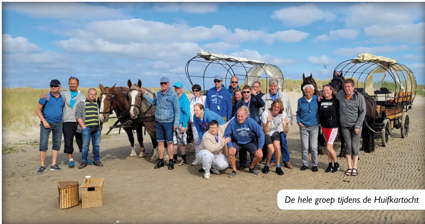
De hele groep tijdens de Huifkartocht

Van 9 t/m 16 september bezochten we weer het prachtige eiland Terschelling met 14 deelnemers en 5 begeleiders. Het mooie zomerweer was gelukkig nog niet op.