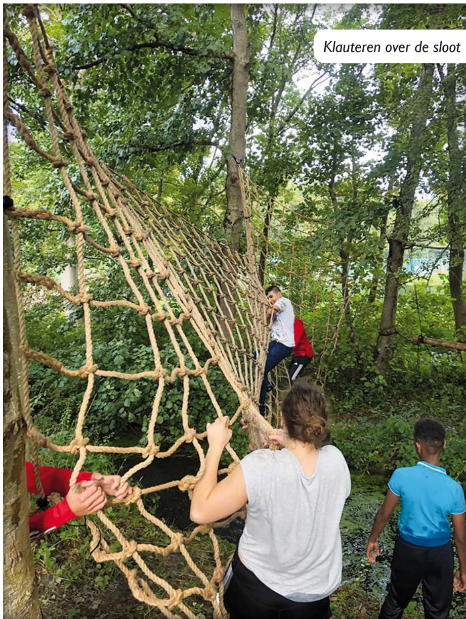
Klauteren over de sloot

Deze dagen konden niet plaatsvinden zonder hulp van de studenten van ROC Mondriaan en natuurlijk onze sponsors Jeugd Vakantieloket en Pasman stichting, bedankt!