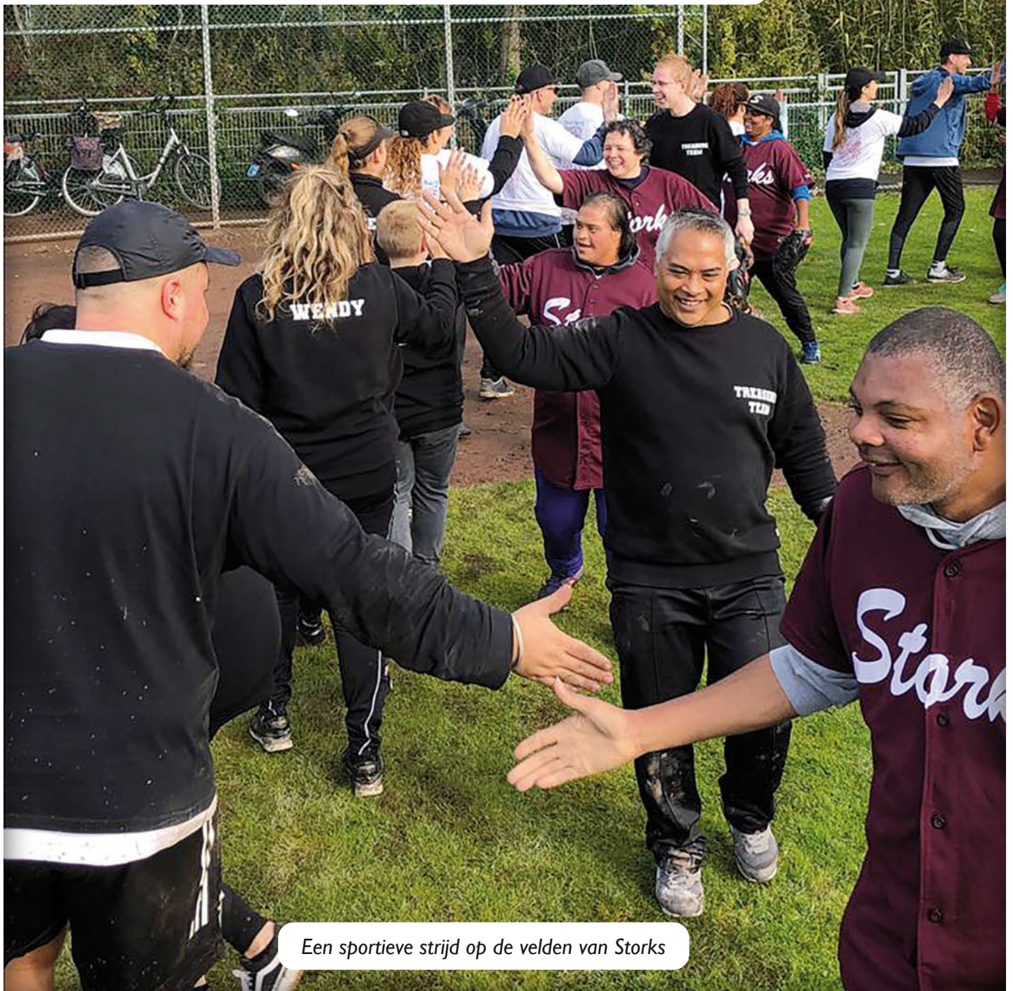
Een sportieve strijd op de velden van Storks

Bedankt voor de organisatie en alle teams bedankt voor de sportieve strijd!