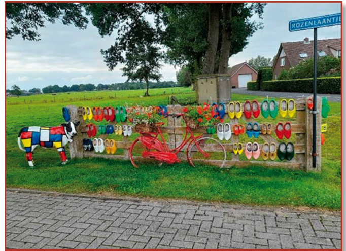
Eén van de foto's onderweg

Onderweg was er halverwege de route koffie of thee met gebak beschikbaar. Ook dat werd op prijs gesteld.