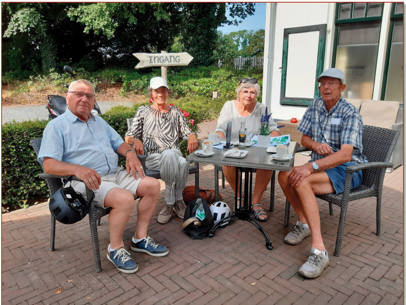
Even bijkomen onderweg

Al met al een geslaagd evenement en een poging om elkaar weer eens te ontmoeten in deze coronatijd met al z'n beperkingen.