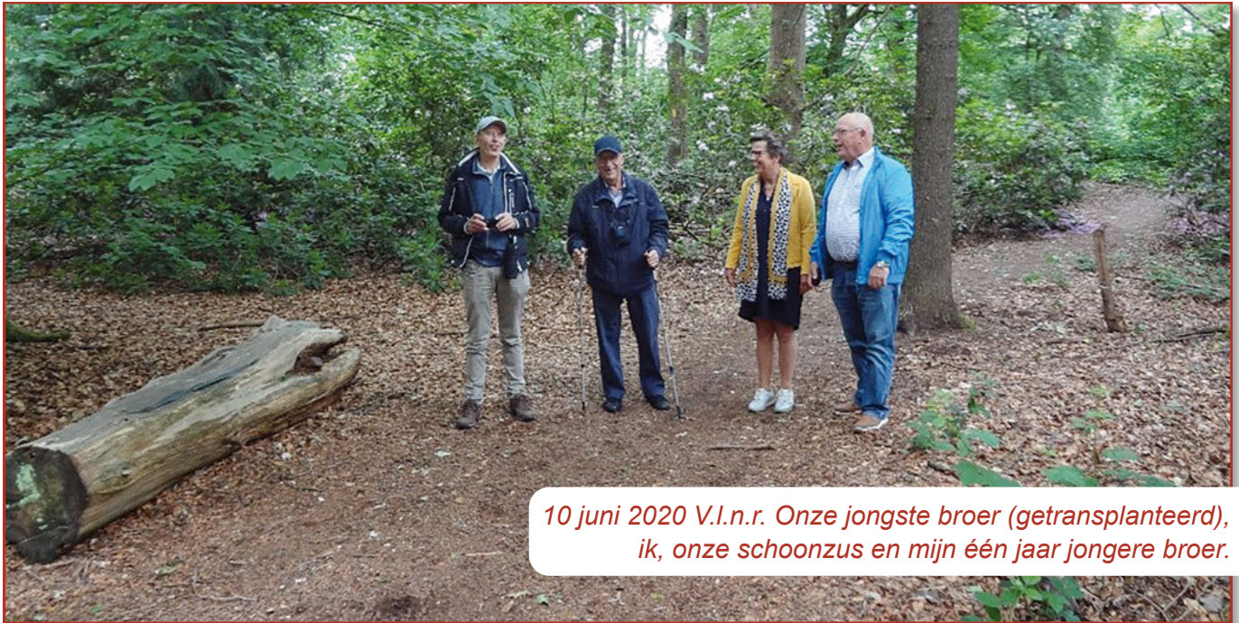
10 juni 2020 V.I.n.r. Onze jongste broer (getransplanteerd), ik, onze schoonzus en mijn één jaar jongere broer.

De dokter heeft ons de eerste periode elke dag gebeld. Hier zijn we erg blij en dankbaar voor.